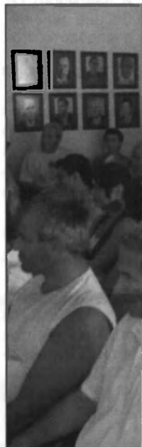
В края на всеки с колеги или уч място – там в лекции, но и но обикновено са г